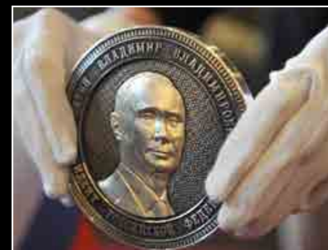
Există o monedă digitală numită PutinCoin