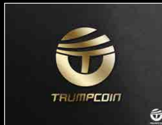
Donald Trump are propria sa monedă digitală, numită TrumpCoin