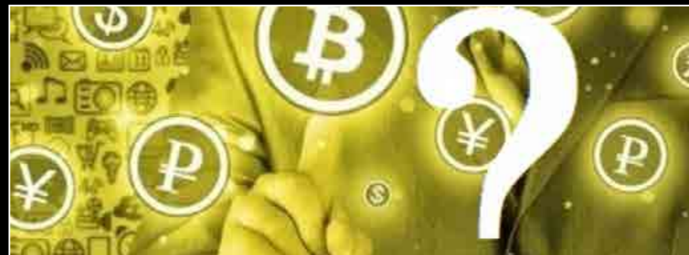
Există peste 1.500 de criptomonede în lume în acest moment